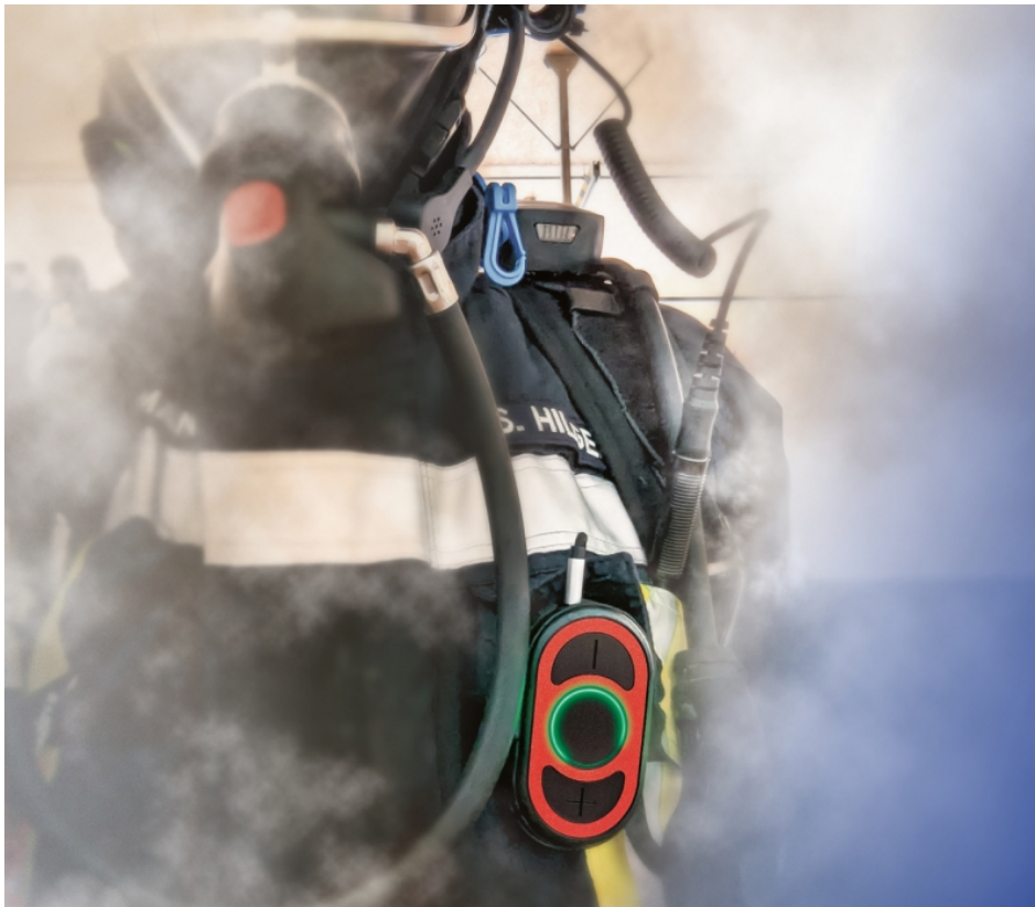
»PTFireCom« im Einsatz.

Auf der »PMRExpo 2025« präsentiert pei tel neue und aktualisierte Systemlösungen für die kritische Kommunikation. Im Mittelpunkt stehen praxisnahe Entwicklungen, die gemeinsam mit Anwendergruppen erarbeitet wurden und auf dem Messestand in Köln live demonstriert werden.