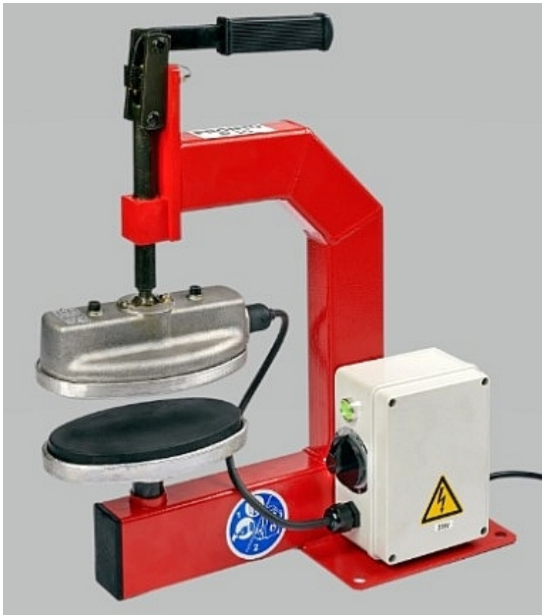
»Pronto P10«

Ist ein Schlauch undicht oder beschädigt, besteht neben der Entsorgung und Neubeschaffung auch die Möglichkeit der Reparatur. Durch das Vulkanisieren kann der Schlauch wieder gemäß DIN 14811 eingesetzt werden. Nach Einsätzen und Übungen werden Schläuche auf Dichtheit geprüft und mit einem Arbeitsdruck von 16 bar getestet. Werden dabei Schäden festgestellt, können diese mit dem »Pronto P10« behoben werden.