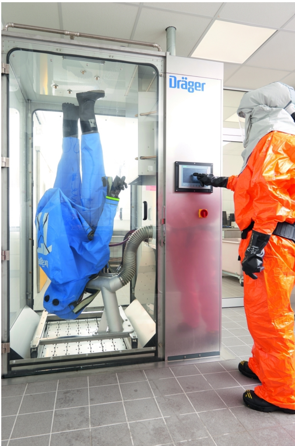
Multifunktionskabine MFC von Dräger

Die MFC 7000 ist Drägers vollautomatische Lösung für die Aufbereitung von PSA nach dem Einsatz. In einem einzigen Arbeitsgang reinigt, desinfiziert und trocknet die MFC 7000 beispielsweise Atemschutzausrüstung oder Chemikalienschutzanzüge. So steht die PSA innerhalb kürzester Zeit wieder zur Verfügung. Der Anwender kann die MFC 7000 schnell und ohne Werkzeug bestücken. Von der Beladung bis zur Entnahme der Ausrüstung ist der komplette Aufbereitungsprozess in weniger als zwei Stunden abgeschlossen. Ein wärme- und schallisoliertes Kabinengehäuse gewährleistet Energieeffizienz. Für die Dräger Multifunktionskabine MFC 7000 sind neue Gestellwagen