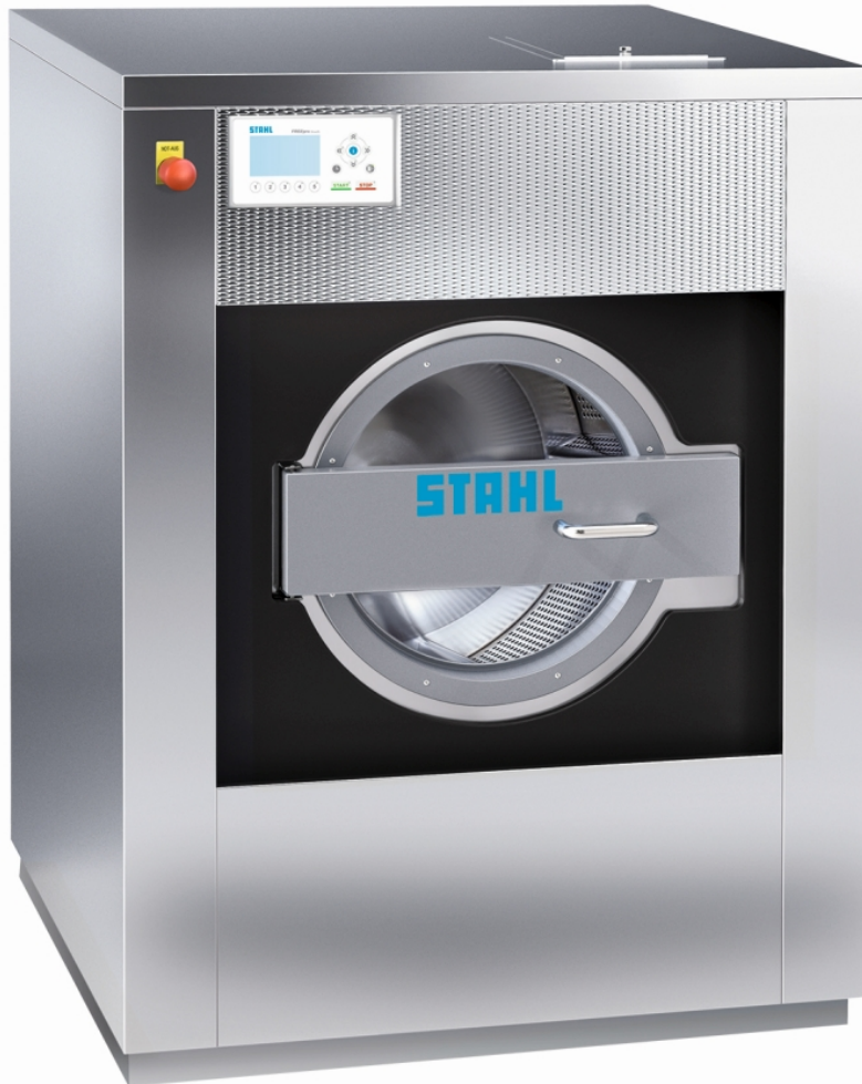
Hochtourige Profi-Waschmaschine »Atoll«.

Die hochtourige Profi-Waschmaschine »Atoll« von Stahl ist in 15 verschiedenen Größen mit Füllmengen von 6 bis 115 kg erhältlich. Sie eignet sich hervorragend für die gründliche und schonende Reinigung von Schutzkleidung und Feuerwehrausrüstung. Dank ihrer robusten Bauweise und frei programmierbaren Steuerung lässt sich die »Atoll« optimal an die spezifischen Bedürfnisse von Feuerwehren anpassen.